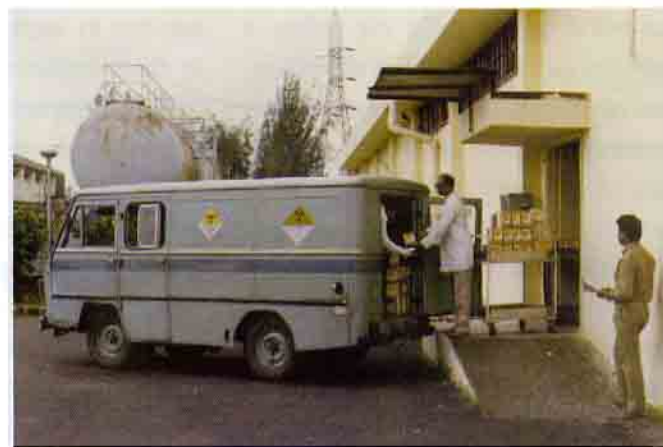
रेडिओ आइसोटोपों को विपणन के लिए तैयार किया जा रहा है

ब्रिट ने अपने उत्पादों और सेवाओं के विपणन के लिए देश भर में एजेंटों को नियुक्त किया है। नए उत्पादों एवं क्षेत्रों की एजेंसी लेने के संबंध में पूछताछ का स्वागत है।