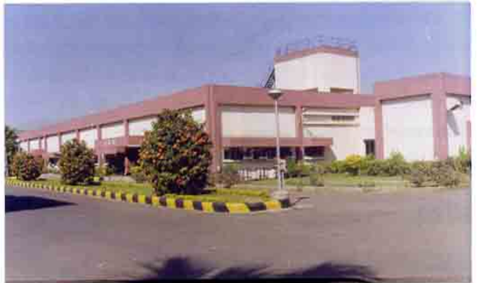
चिह्नित यौगिक प्रयोगशाला, वाशी, नवी मुंबई

आपूर्ति किए जाने वाले कुछ महत्वपूर्ण चिह्नित यौगिक हैं : ^{32}\text{P} चिह्नित न्यूक्लिओटाइड, ^{33}\text{P} चिह्नित न्यूक्लिओटाइड, ^{35}\text{S} चिह्नित अमिनो अम्ल तथा dATP, ^{14}\text{C} चिह्नित यौगिक, ग्राहकों की आवश्यकतानुरूप संश्लेषित ^{14}\text{C} तथा ^3\text{H} यौगिक, ^3\text{H} चिह्नित यौगिक जिनमें ट्रीशियम चिह्नन सेवा शामिल है तथा जीव-विज्ञान अनुसंधान/रेडिओसक्रियताहीन चिह्नन के लिए शीत किट (cold kit)।