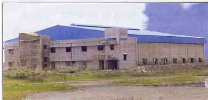
ऑरगॅनिक ग्रीन फूड्स, कोलकाता

ब्रिट, अनेक वर्षों के अपने अनुभव के आधार पर तथा हासिल की गई विशेषज्ञता के बल पर विकिरण संसाधन संयंत्रों के लिए आवश्यक हर प्रकार की तकनीकी सहायता प्रदान करता है। यहाँ तक कि विभिन्न