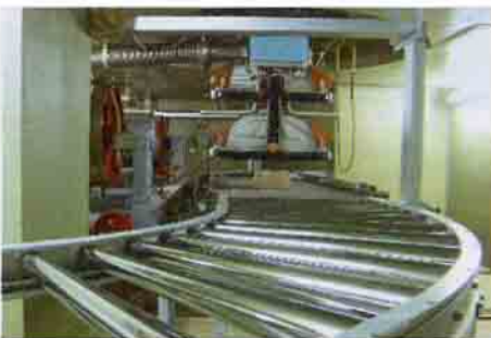
इलेक्ट्रॉन बीम त्वरक

ब्रिट, वाशी कॉम्प्लेक्स स्थित 2 MeV औद्योगिक इलेक्ट्रॉन किरणपुंज त्वरक द्वारा वाणिज्यिक स्तर पर किरणन सेवाएं प्रदान की जाती हैं। यह सुविधा विविध सेवाएं उपलब्ध कराती है - जैसे पॉलीमरों का तिर्यक बन्धन (क्रास लिंकिंग) तथा उनका निम्नीकरण, बहुमूल्य रत्नों के रंगों का अभिवर्धन आदि। इस सुविधा का किरणन क्षेत्र 900 mm x 80 mm आकार का है।