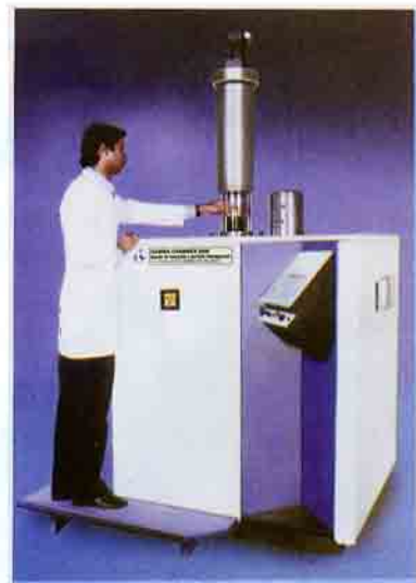
गामा चेंबर (जी सी 5000)

गामा चेम्बर (5000 तथा 1200) सुसंहत स्वपरिरक्षित कोबाल्ट-60 अनुसंधान किरणक है जिसमें अधिकतम 518 TBq (14 KCi) तथा 185 TBq (5 KCi) स्रोत का भारण किया जा सकता है। ये, किरणन के लिए क्रमशः 5000 सीसी तथा 1200 सीसी आयतन उपलब्ध कराते हैं। उपकरण की बाहरी सतह पर विकिरण की मात्रा अनुमेय स्तर से काफी कम होती है। इसकी स्थापना के लिए एवं इसे उपयोग में लाए जाने के लिए अतिरिक्त परिरक्षण की आवश्यकता नहीं होती। किरणन समय के नियंत्रण के लिए इसमें पीएलसी आधारित नियंत्रण प्रणाली लगाई गई है। इसमें निम्न या उच्च ताप पर उत्पाद किरणित करना संभव है। स्रोत पेन्सिल सिलिंडर के आकार के पिंजड़े में इस तरह रखी होती है कि