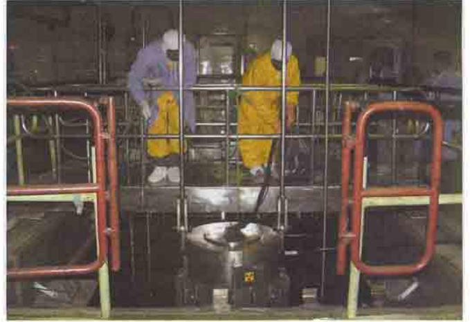
रॅपकॉफ सुविधा, कोटा, राजस्थान

कोटा, राजस्थान स्थित रॅपकॉफ सुविधा, ब्रिट के समस्त कोबाल्ट आधारित कार्यक्रमों का मुख्य स्रोत है। इसके जल-कुंड की क्षमता 30 लाख क्यूरी कोबाल्ट-60 रखे जा सकने की है। किरणित एडजस्टर छड़े रिएक्टर से इस सुविधा में लाई जाती हैं जहाँ उनसे कोबाल्ट-60 निकाला जाता है और अगले संसाधन के लिए ट्रॉम्बे भेजा जाता है।