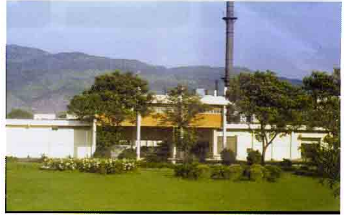
रेडिओमेषज प्रयोगशाला, वाशी, नवी मुंबई

ब्रिट कई प्रकार के रेडिओमेषजों का उत्पादन करता है जैसे :