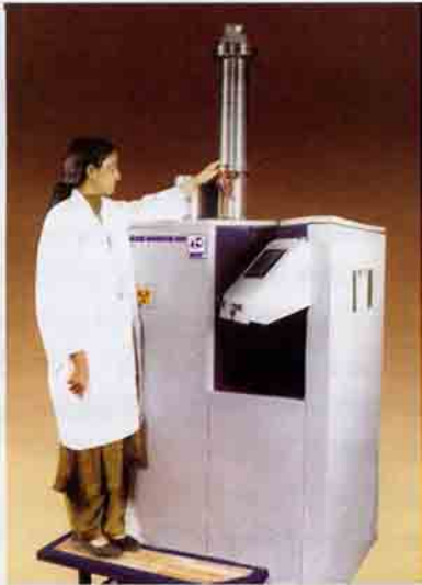
रक्त किरणक (बी आई 2000)

कमजोर प्रतिरक्षा प्रणाली वाले मरीजों को खून चढ़ाने के बाद उन्हें संभवतः होने वाली जानलेवा बीमारी T-GVHD के खतरे को लगभग समाप्त करने का सुरक्षित एवं प्रमाणित तरीका है गामा किरणों द्वारा रक्त का किरणन करके टी-लसीकाणुओं का प्रचुरोद्भवन रोकना। अनुसंधान द्वारा यह सिद्ध हो चुका है कि वर्तमान में इस बीमारी के खतरे को लगभग समाप्त करने का सर्वोत्तम तरीका है कोशिकीय रक्त घटकों का गामा किरणन करना। अतः इस बीमारी की समस्या का हल करने के लिए जीवनदायिनी के रूप में, दुनिया भर के अस्पतालों एवं रक्त बैंकों में गामा किरणन पद्धति अपनाई जा रही है। ब्रिट ने रक्त किरणक - 2000 (BI 2000) नामक एक खास रक्त किरणक अभिकल्पित एवं विकसित किया है। यह स्व-परिरक्षित, सुसंहत एवं अनोखा गामा किरणक है जिसमें 30 TBq (810 क्यूरी) तक कोबाल्ट-60 स्रोत भरित किया जा सकता है। किरणन चेम्बर के अंदर यह लगभग 11 ग्रे/मिनट विकिरण-मात्रा दर उपलब्ध कराता है।