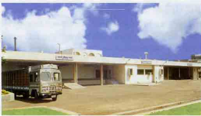
विकिरण संसाधन संयंत्र, वाशी, नवी मुंबई

भारत में खाद्यान्न परिरक्षण अनेक पारम्परिक तरीकों से किया जाता रहा है। इसके ऐसे नए-नए तरीकों की खोज भी की जाती रही है जिससे खाद्यान्न की संवेदी गुणवत्ता बरकरार रहे या उस पर कम से कम असर हो। खाद्य उत्पाद की पूरे साल उपलब्धता की दृष्टि से उसके परिरक्षण की आवश्यकता महसूस की जाती रही है। गरम एवं आर्द्र मौसम में कीड़े एवं सूक्ष्म जीव अन्न पदार्थ खराब कर देते हैं। विकिरण प्रौद्योगिकी, खाद्यान्न परिरक्षण के लिए विकसित नवीनतम विधियों में से एक है। वाशी स्थित संयंत्र मसालों, पालतू पशु-पक्षियों के खाद्यों, आयुर्वेदिक कच्चे माल, ईसबगोल, पैकेजिंग उत्पाद आदि के विकिरण संसाधन के लिए सेवाएं प्रदान करता है। इसमें उपरोक्त सामग्री को कोबाल्ट-60 स्रोत से निकलने वाले गामा विकिरण से उद्भासित किया जाता है।