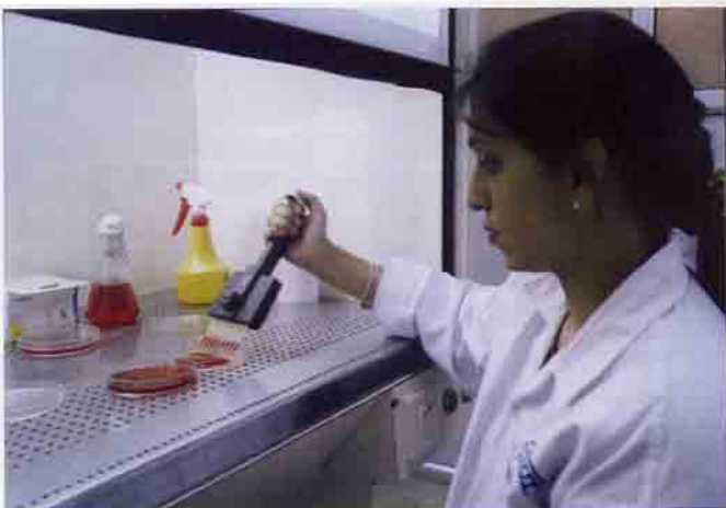
रेडियो प्रतिरक्षा आमापन प्रयोगशाला, वाशी, नवी मुंबई

TSH (iii) इनसुलिन (iv) मानव वृद्धि हॉर्मोन (v) मानव जरायु गोनाडोट्रोफिन, HCG (vi) मानव पीतपिंडीकर हॉर्मोन, HLH तथा (vii) मानव प्रोलैक्टिन