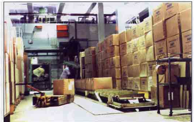
ट्रांबे, मुंबई स्थित आइसोमेड संयंत्र

गामा विकिरण द्वारा निर्जर्मीकरण के फायदे निम्नानुसार हैं : यह एक शीत प्रक्रिया है अतः ऊष्मासंवेदी प्लास्टिक वस्तुएं भी सुरक्षित रूप से निर्जर्मित की जा सकती हैं। गामा विकिरण की उच्च भेदन क्षमता के