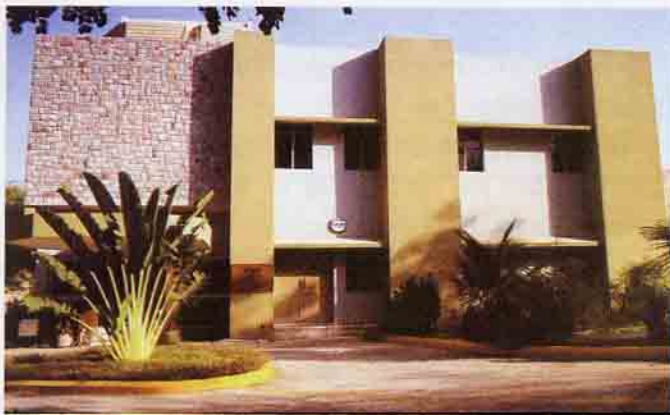
हैदराबाद स्थित जोनाकी प्रयोगशाला

उदाहरण है ब्रिट की जोनाकी प्रयोगशाला जो हैदराबाद स्थित कोशिकीय एवं अणुजैविकी केंद्र के परिसर में स्थित है। ब्रिट का यह एकक, एक दर्जन से भी अधिक फास्फोरस-32 चिह्नित न्यूक्लियोटाइडों तथा अणुजैविक कितों की आपूर्ति देशभर के उपयोगकर्ता संस्थानों को नियमित रूप से करता है।