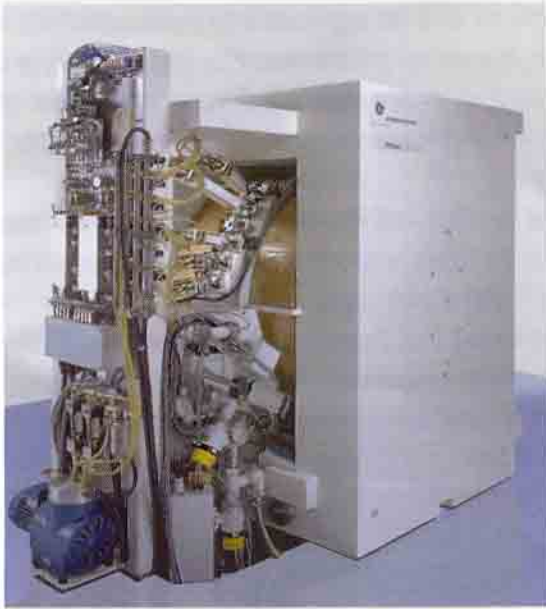
टाटा स्मारक अस्पताल में स्थापित मेडिकल साइक्लोट्रॉन सुविधा