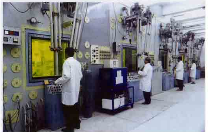
रेडिओसक्रिय प्रकोष्ठ (हॉटसेल) सुविधा, ट्रांबे, मुंबई